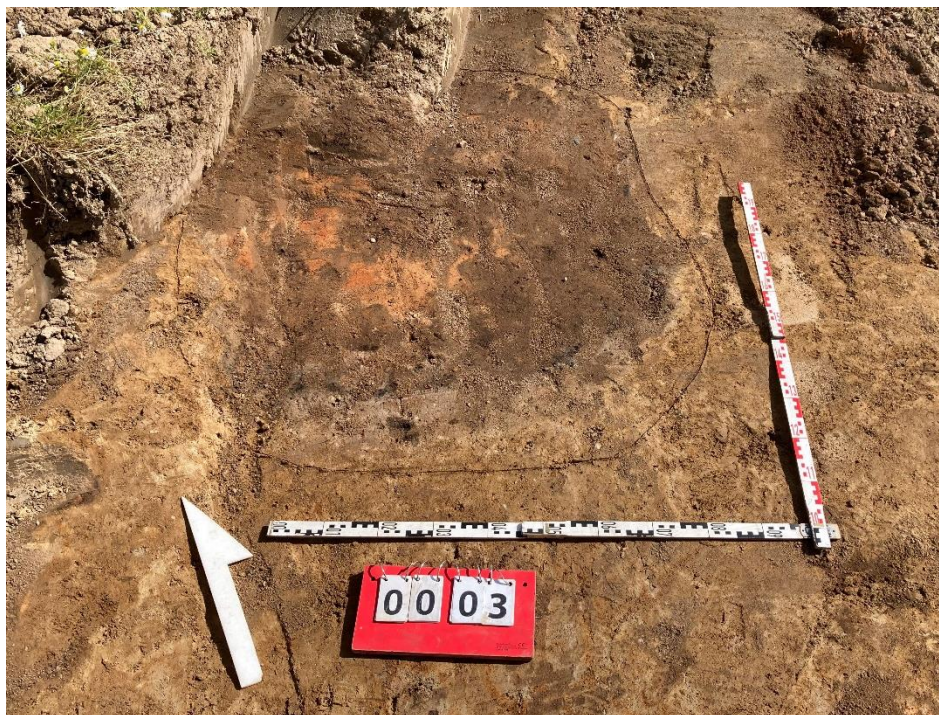
Fot. 5 Obiekt archeologiczny nr 3.