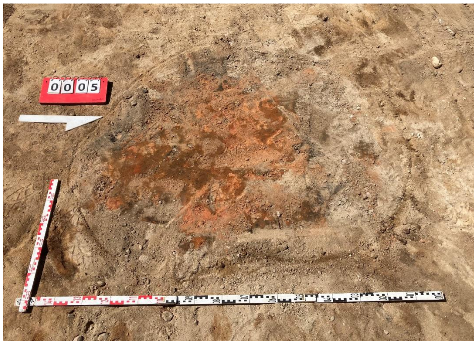
Fot. 7 Obiekt archeologiczny nr 5.