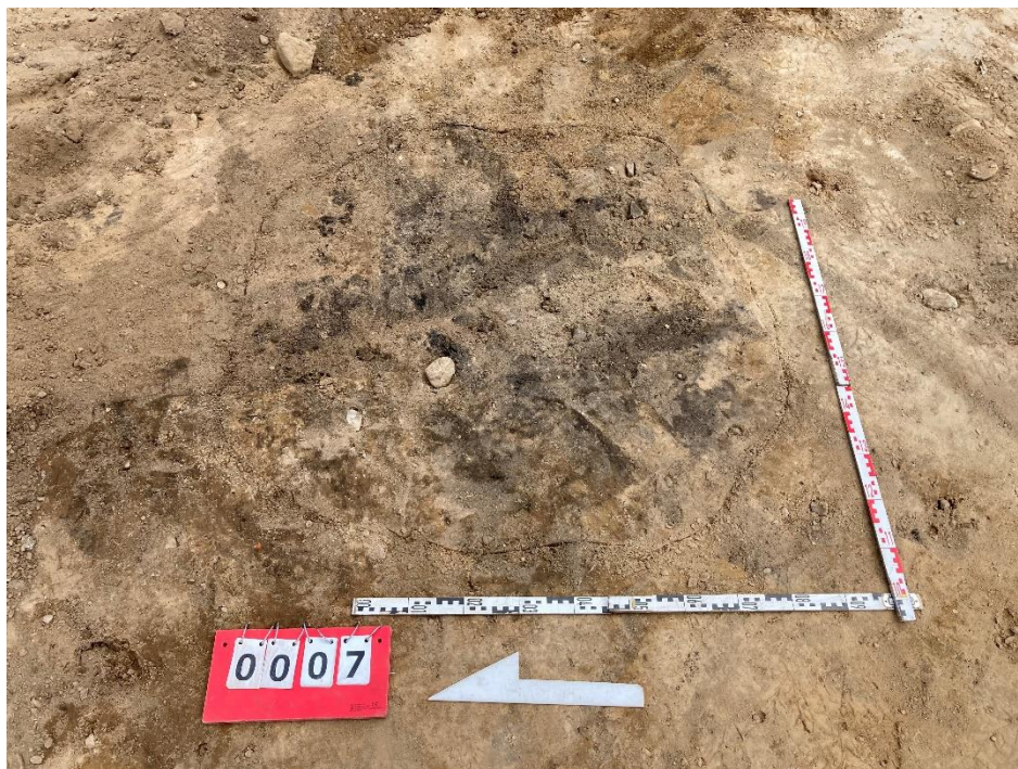
Fot. 9. Obiekt archeologiczny nr 7.