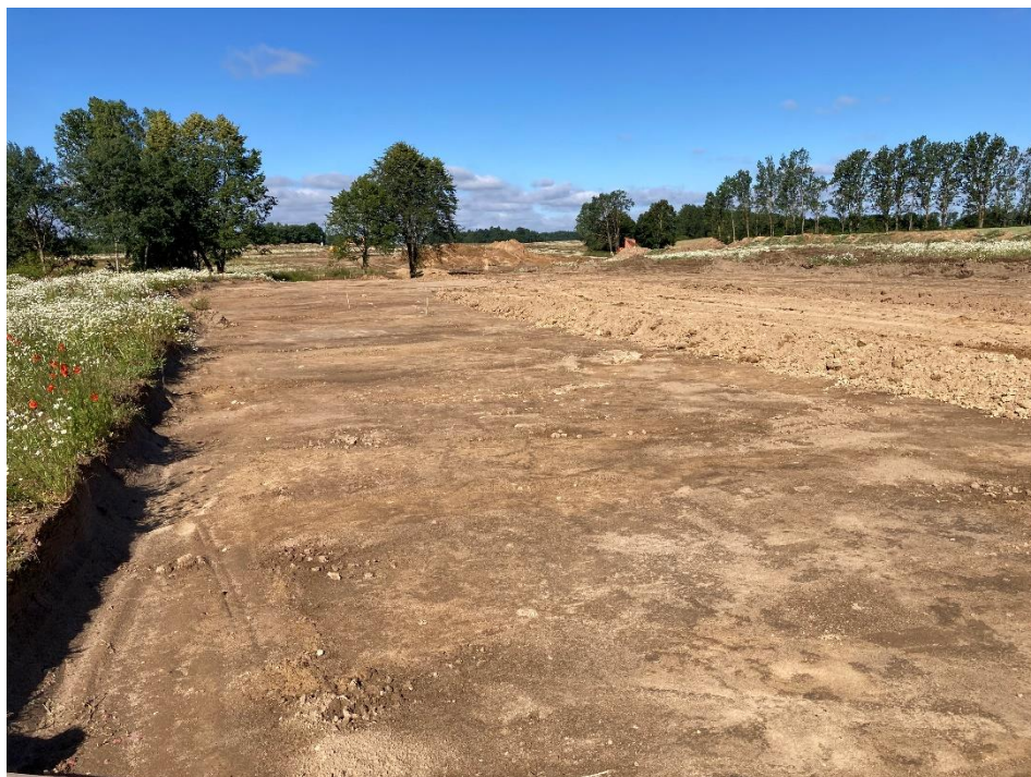
Fot. 1 Obszar odhumusowania (część wschodnia).