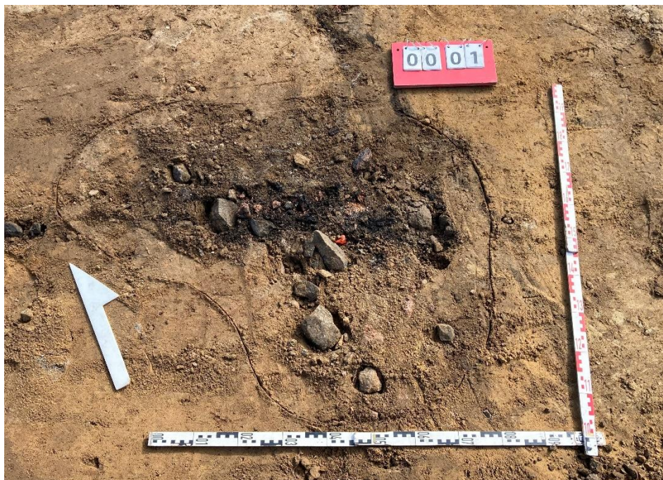
Fot. 3 Obiekt archeologiczny nr 1.