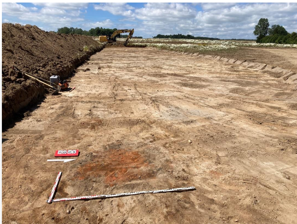
Fot. 2 Obszar odhumusowania (część zachodnia).