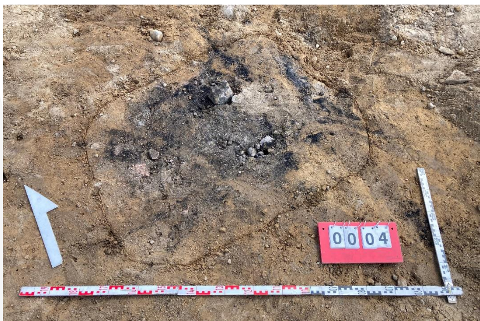
Fot. 6 Obiekt archeologiczny nr 4.