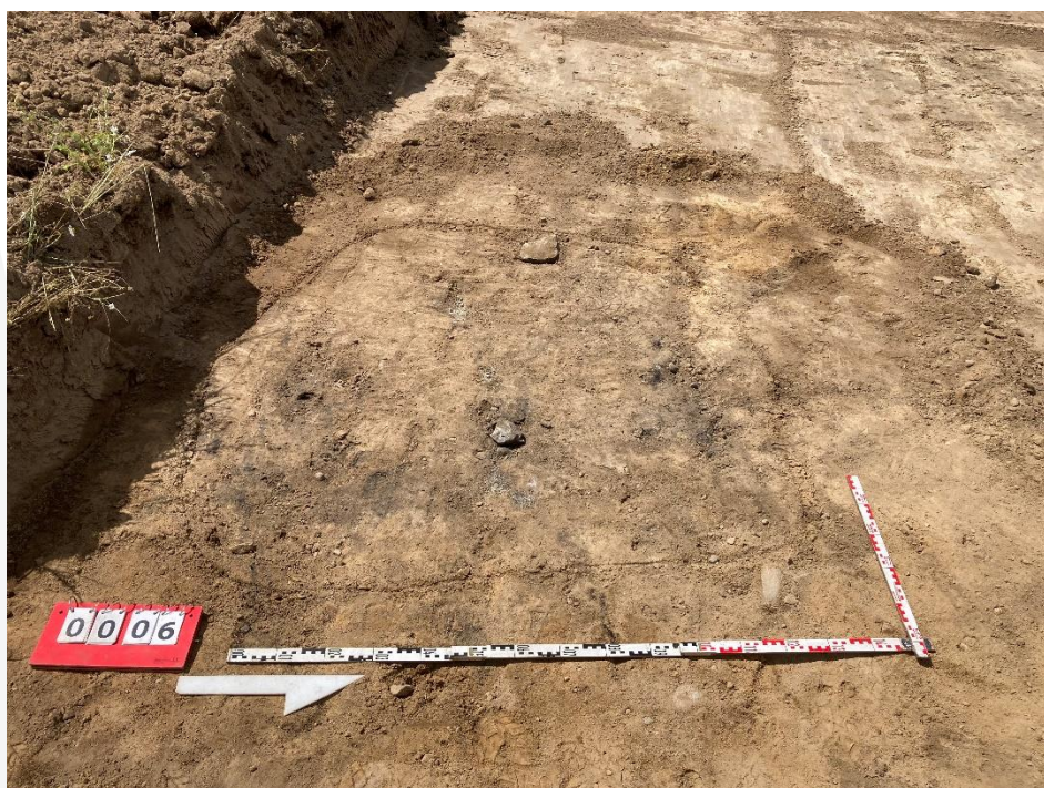
Fot. 8 Obiekt archeologiczny nr 6.