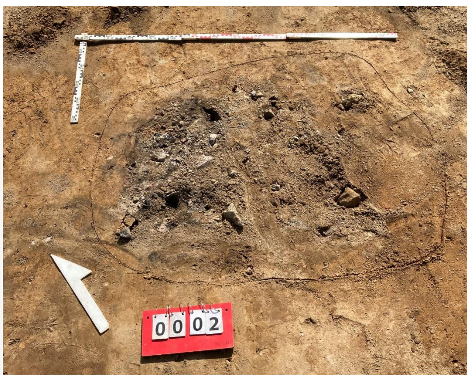
Fot. 4 Obiekt archeologiczny nr 2.