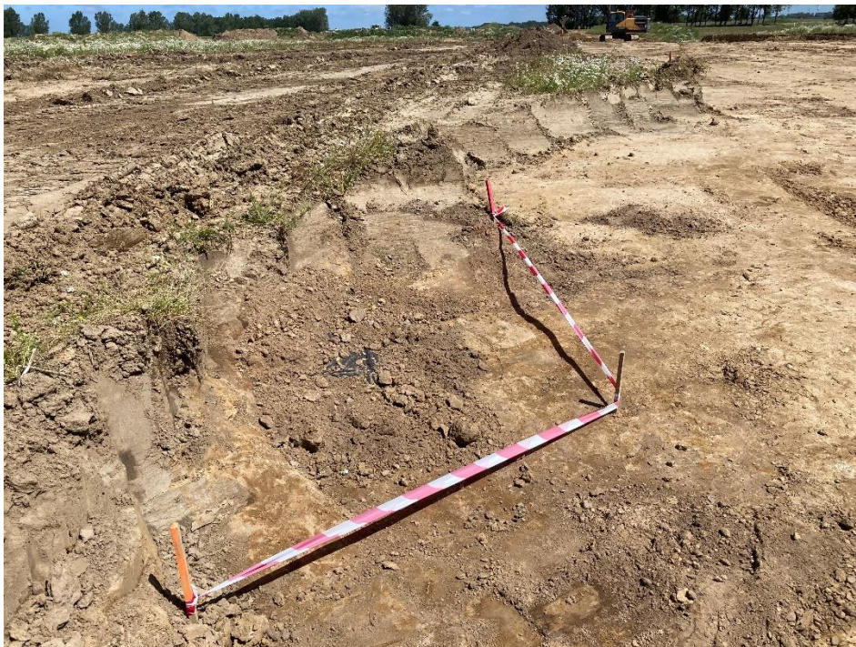
Fot. 11. Odkryte obiekty oznakowane i wstępnie zabezpieczone.