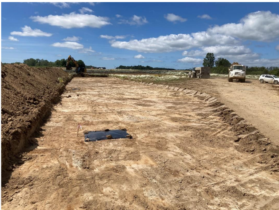
Fot. 12. Odkryte obiekty oznakowane i wstępnie zabezpieczone.