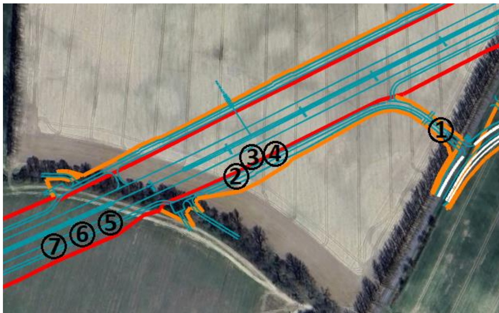
Ryc. 1. Lokalizacja skupisk odkrytych obiektów archeologicznych (ob. 1–7), w ciągu DD13.