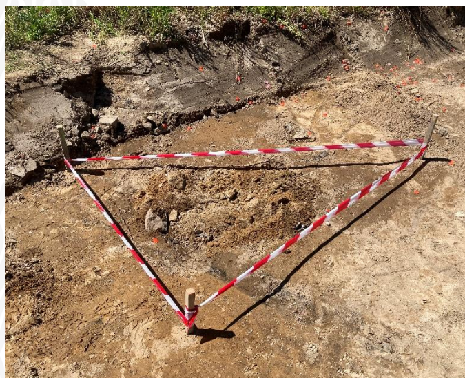
Fot. 10. Odkryte obiekty oznakowane i wstępnie zabezpieczone.